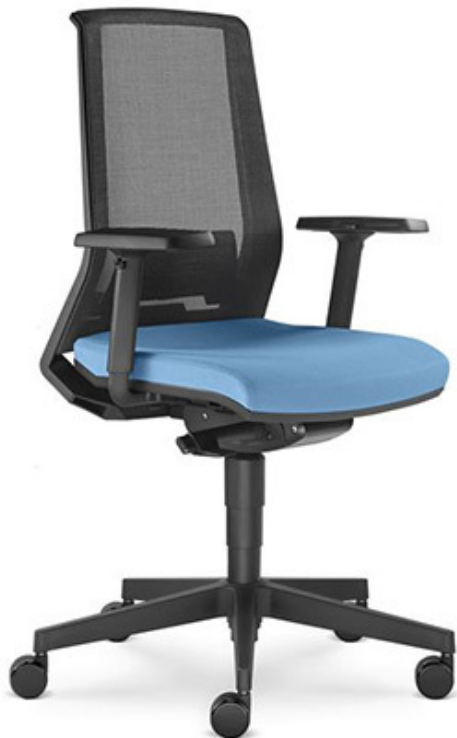
Židle kancelářská přisedová CO2