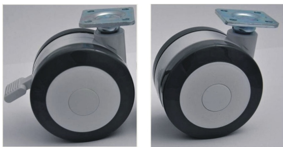
Kolečko otočné, s brzdou